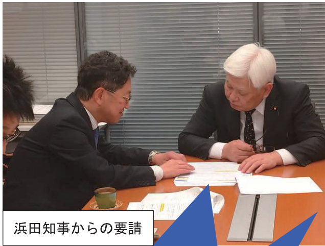
浜田知事からの要請