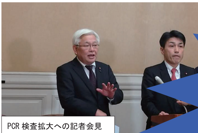
PCR 検査拡大への記者会見